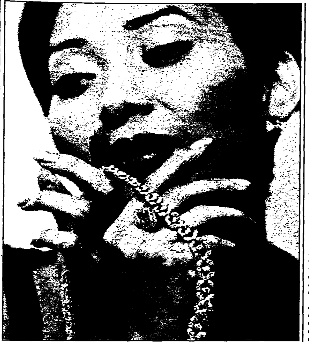
مونغ كونغ - رويترز: عرضت قاعة مزادات كريستي أمس الإرباع كبير ماسة وردية اللون ستباع في مزاد في هونغ كونغ في أواخر الشهر...